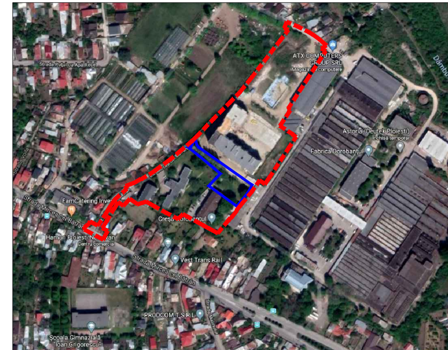
INCADRARE IN ORTOFOTOPLAN sc 1:5000